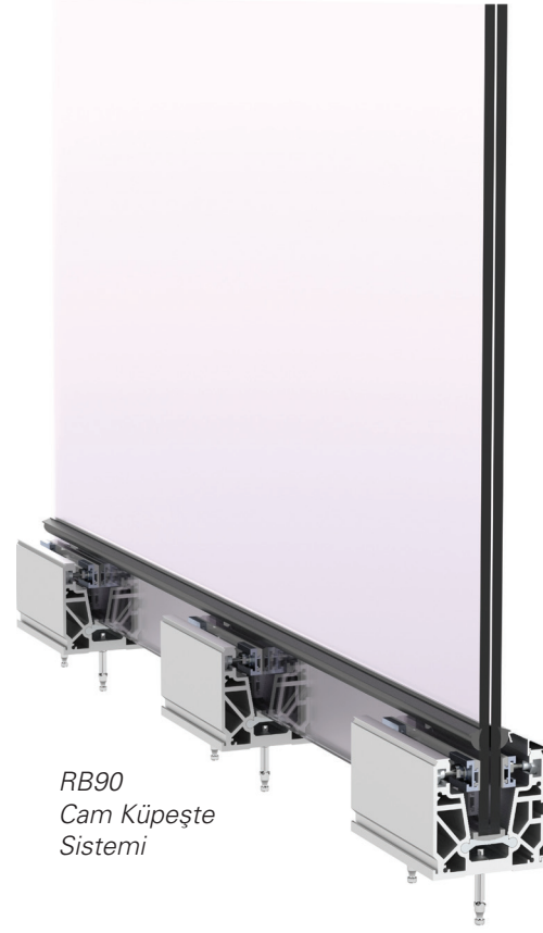
RB90 Cam Küpeşte Sistemi

ratif olarak camın ön plana çıktığı korkuluk sistemlerinin yaygınlaşmaya başladı. Yenilikçi bir yaklaşımla tasarladığımız cam küpeşte ürünümüz RB 90'ın, bu yeni trendi yapılarında kullanmak isteyenler için farklı ve özellikli bir alternatif olacağı kanısındayız. Bu yıl içerisinde sunacağımız ve sürme serilerine farklı bir bakış açısı getireceğimiz iki yeni ürünümüzün çalışmaları da devam ediyor. Yılın ikinci yarısı itibari ile bu ürünlerimiz de devreye girecek. Yine gerek dış cephe gerekse iç mekan uygulamalarında kullanılacak yeni kompozit panel yüzey alternatifleri ile sektörümüze önemli sürprizlerimiz olacaktır.